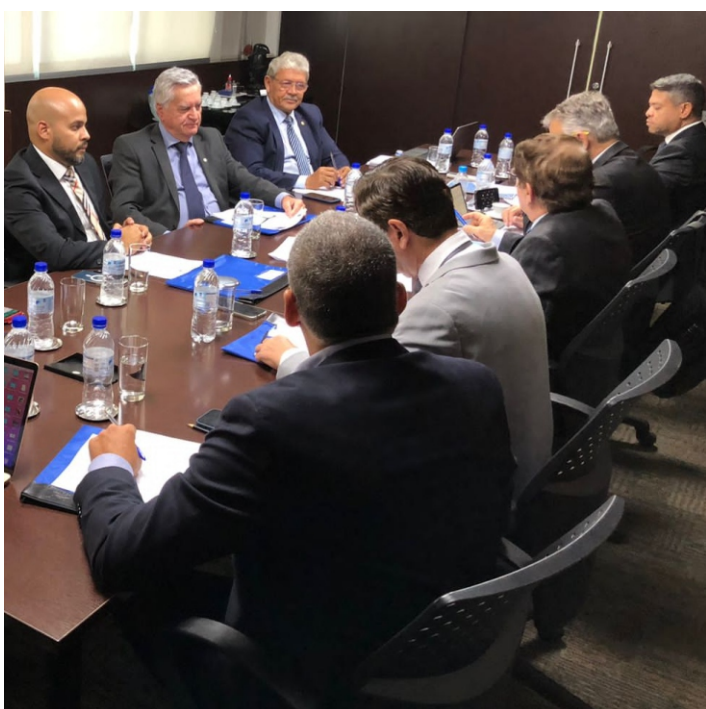
Diretores discutem inovação tecnológica e capacitação para os profissionais do mercado imobiliário

N a primeira reunião de 2023, no dia 1º de fevereiro, a Diretoria Executiva do Sistema Cofeci-Creci estabeleceu as prioridades de gestão para este ano e as ações estratégicas para atender o corretor de imóveis e valorizar o mercado imobiliário. Na pauta, inovação tecnológica, capacitação para os profissionais imobiliários e ferramentas para dar celeridade às transações do setor, com redução de custo, entre outras iniciativas.